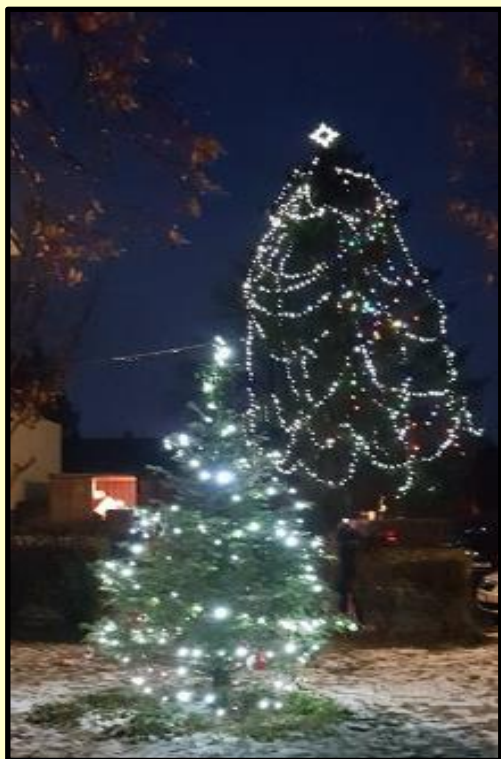
Náš vánoční strom a stromeček