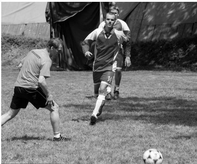
ilustrace foto: Mojmír Motýlka