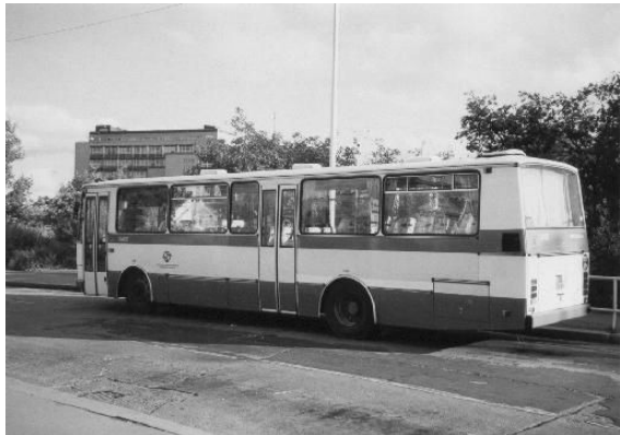
ilustrační foto (www.prahamhd.vhd.cz)

Noční dopravní obsluha okrajových částí Prahy byla rozšířena. V písměnské dopravě byla zavedena nová noční autobusová linka 608 z Prahy-Kobyliš přes Zdiby, Klecany a Klíany do Odoleny Vody (odjezd v 1.30 hod., po posledním spoji metra C). Tato linka je v provozu pouze v uvedeném směru, v noci z pátku na sobotu a ze soboty na neděli.