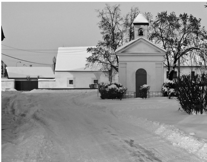
Sněhová kalamita, kolik stojí? více uvnitř