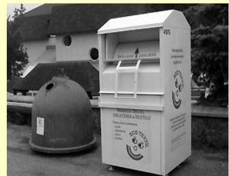
Autor: Jana Motyčková

Stejně jako první kontejner i tento je provozován bezplatně a je vybaven bezpečnostní přepážkou, která zabraňuje neoprávněnému vniknutí.