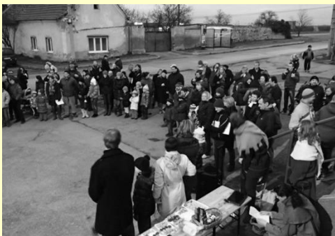
Autor: Jana Motyčková