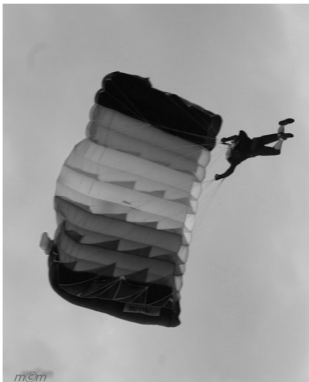
Seskok parašutistů z Mladé Boleslavi zorganizoval MK Postřižín

Stanoviště s jednotlivými disciplínami si pro děti připravili členové SK Lípa Postřižín. Děti kromě razítka dostali navíc i nějakou sladkost. Některé disciplíny byly tak lákavé, že občas za děti na kočár-