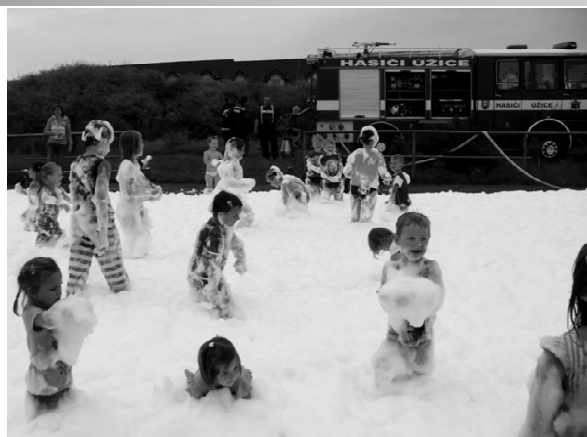
Vítání prázdnin; autor: Jaroslav Plocek

Na tomto místě bych ráda poděkovala všem, kdo se na přípravě Vítání prázdnin podílel a vlastně počasí, že pro jednou nepršelo. Pro rodiče mám malou dobrou radu na závěr: až zase