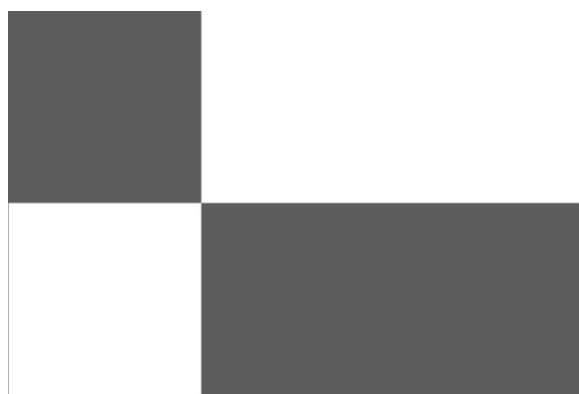
Vlajka - list tvoří zelené karé nad stejně velkým bílým polem a dva vodorovné pruhy, bílý a zelený. Poměr šířky k délce listu je 2 : 3.