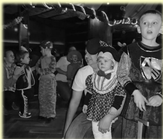
Autor: Jana Motyčková

Karneval pro děti proběhl 23. března a tentokrát se především z kapacitních důvodů konal v klubu Santa Maria v Odoleně Vodě. Na rozdíl od nedělního pochmurného počasí, na parketu panovala skvělá nálada. Děti nejen tancovaly, ale i soutěžily, a to jak v tanci, ve zpěvu, tak v dalších disciplínách.