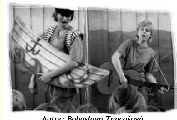
Autor: Bohuslava Tancošová

Na konci února jsme měli možnost v Postřižíně shlédnout divadelní představení pro děti „Jak na obra“, pohádku o dvou českých Honzech, dvojčatech, kteří zachrání princeznu před obrem. A představte si, že i velký obr se vešel do miniaturních prostor obecního úřadu. Úžasnou pohádku s osobitým hudebním doprovodem zahrálo pražské divadlo z Pytlíčku a děti si ho opravdu užili.