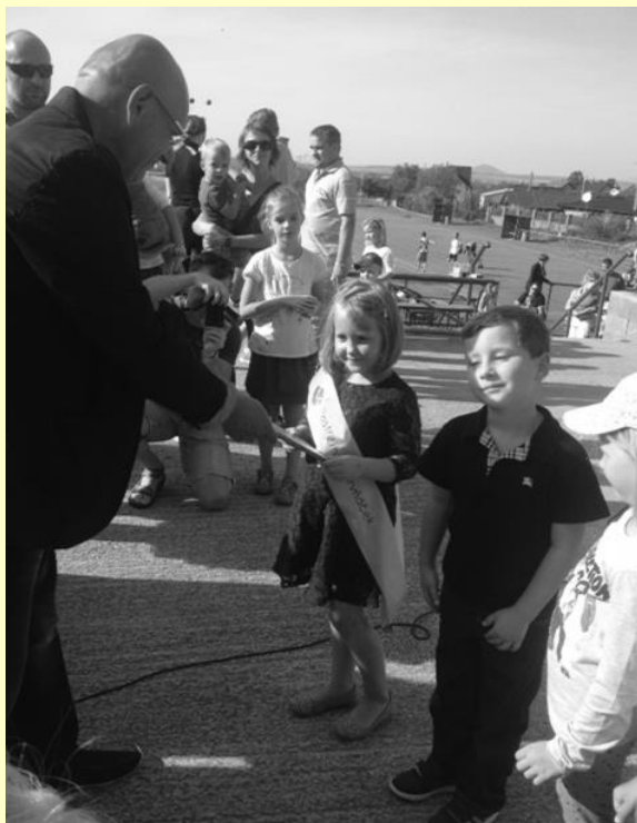
Fotografie z akce Cesta za pohádkou;

Na cestě za pohádkou děti plnily úkoly, které jim zadávaly různé pohádkové bytosti - rusalka, pavoučice, Krakonoš, viking či samotný rytíř. Odměnou za splněné úkoly byly nejen drobnosti, které děti dostaly na konci cesty, ale také skákací hrad, horolezecká stěna či kolotoč na fotbalovém hřišti. V průběhu celého odpoledne měli děti ale i dospělí možnost vyzkoušet si bubnování na africké bubny pod vedením lektora Jana Vorlíčka. V 16:00 hodin