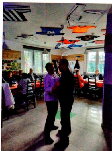
Obr. 7 a 8 Setkání seniorů