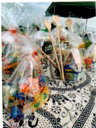
Obr. 4 Odměny

V sobotu 11. září 2021 se uskutečnil další ročník akce POSTŘÍŽÍNSKÝ GULÁŠFEST. Již od rána se pracovalo na přípravě guláše a brzy to na hřišti vonělo cibulkou a všemi dalšími surovinami. I letos proběhla v rámci Gulášfestu soutěž POSTŘÍŽÍNSKÁ BUCHTA a návštěvníci neměli jednoduchý úkol, protože vybrat tu nejlepší bylo opravdu těžké. Všechno bylo vynikající. Na své si přišly i děti, pro které byly připravené kolotoče, skákací hrad, trampolíny a horolezecká stěna. Kromě sportovního vyžití čekal na děti i kulturní zážitek v podobě vystoupení kouzelnice Renaty. Nezapomnělo se ani na tradiční šerpování prvňáčků a tentokrát i druháčků, kteří o to minulý rok přišli. Čekání na guláš nám zpříjemňovalo vystoupení studentů z konzervatoře a kapely a celá akce vyvrcholila koncertem skupiny Kabát revival.