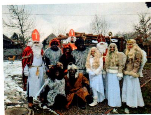
Obr. 9 Mikuláš

Na prosinec se těší každé dítě. Nejen proto, že chodí „Ježíšek“, ale i kvůli „Čertům“. Ani na děti v Postřižíně Mikuláš se svou partou nezapomněl a navštívil je. Čerti se těšili, že si odnesou do pekla nějakého hříšníka, ale nikde neuspěli 😊. Děti Mikuláše a anděla přesvědčily, že do pekla nepatří a po pěkné básničce dostaly od Mikuláše i nějakou tu sladkost.