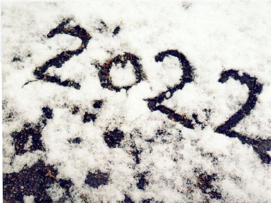
Obr. 1 PF 2022

V druhé polovině roku 2021 proběhla výstavba kruhového objezdu na silnici II/ 608 ulice Teplická v obci Postřizín. Finančně se na akci podílela obec Postřizín a Krajská správa a údržba silnic Středočeského kraje.