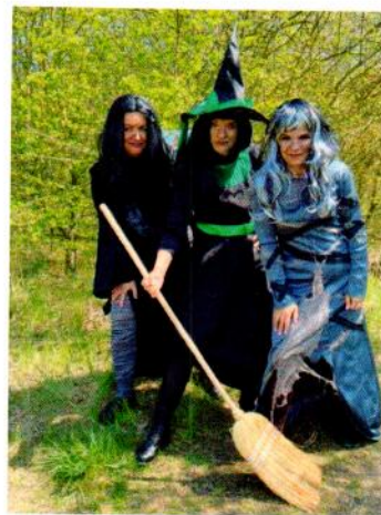
Obr. 2 Čarodejnice

Tak jako všechno, tak i tradiční pálení čarodějnic ovlivnil covid a všechna omezení s ním spjatá. Děti ale o tuto akci nepřišly a „čarodějnice“ byly, i když v trochu jiné podobě, než jsou zvyklé. Kulturní komise připravila pro všechny malé čaroděje a čarodějky dobrodružnou cestu, na jejichž začátku čekaly dvě čarodějky, které děti vybavily kartičkami a ony mohly vyrazit. Po cestě plnily různé úkoly, a navíc je čekaly jejich vlastní obrázky, jimiž byla cesta vyzdobena. Když vše splnily a dostaly se až na konec, tak je dvě čarodějnice odměnily diplomem a čarodějnou sladkostí.