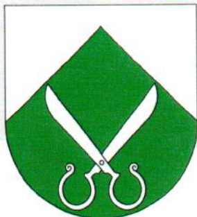
Obec Postřizín - erb