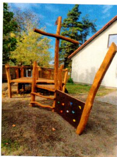
Obr. 6 Hřiště

Rekonstrukce dětského hřiště byla z větší části financována z dotace MMR.